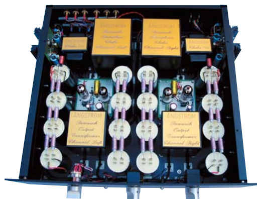
Versione SE con trasformatori d'uscita